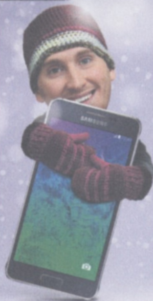
Samsung GALAXY ALPHA

predbežná finančná kontrola podľa § 9 zákona NR SR č. 502/2001 Z.z. o finančnej kontrole a vnútornom audite a o zmene a doplnení niektorých zákonov v znení neskorších predpisov bola vykonaná, nedostatky ne- zistené.